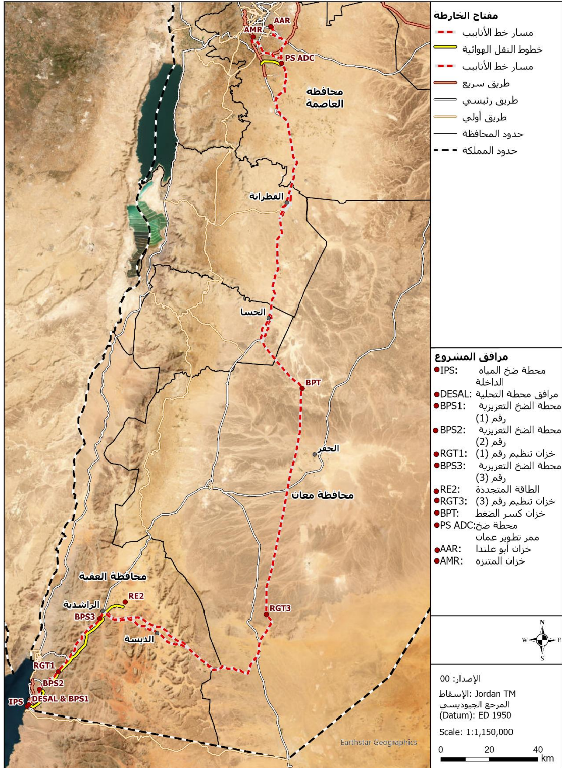
الشكل 1-1 موقع مرافق مشروع الناقل الوطني